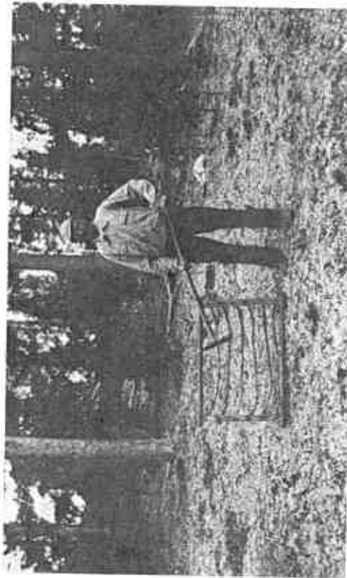
Reiskap for sanking av måså.

Rikdomskjeldene i fjellet var ved århundreskiftet godt nytta. Dette var ikkje berre den eigentlege seterregionen, men og dei høgare fjelltrakter. Frå lenger attende i tida var det fleire gardar jamvel på flatbygdene som sende buskapen sin til høgfjellseter. Mange hadde skaffa seg eigen seter, men oftest tok setereigarer på staden mot leigedyr frå andre trakter.